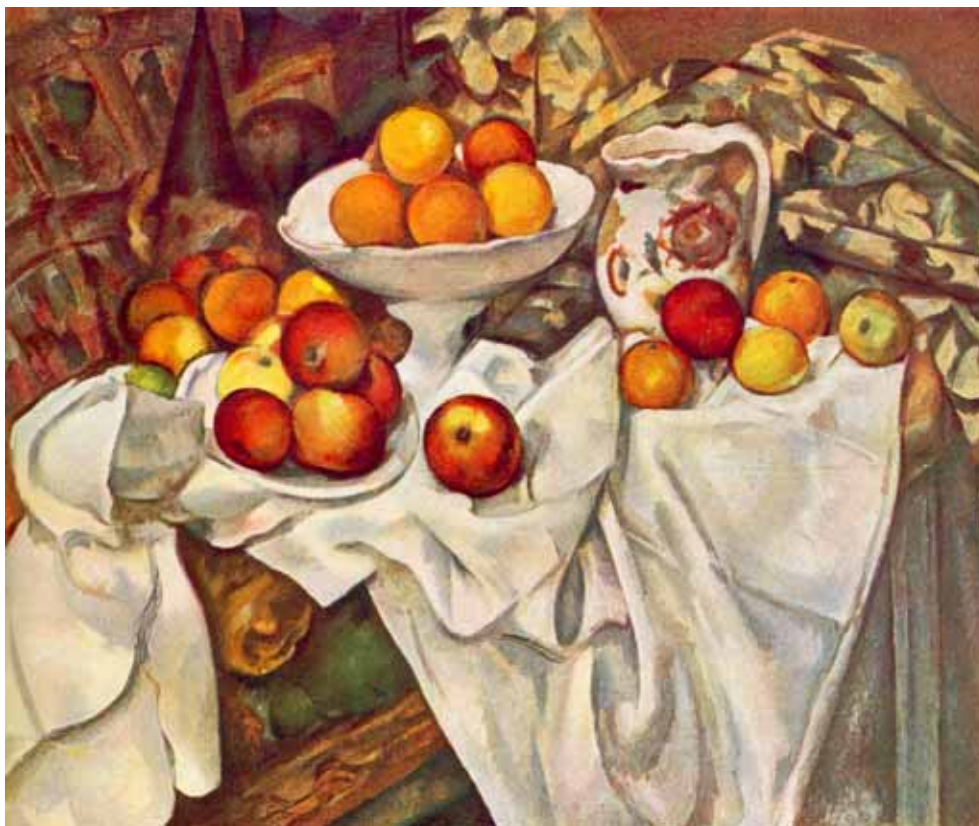
Paul Cézanne, Martwa natura z jabłkami i pomarańczami , ok. 1899 r.