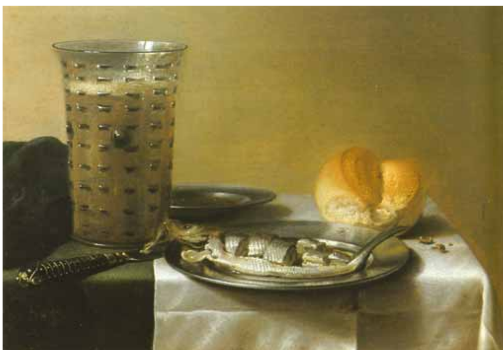
Pieter Claesz, Martwa natura z rybą i chlebem , 1636 r.